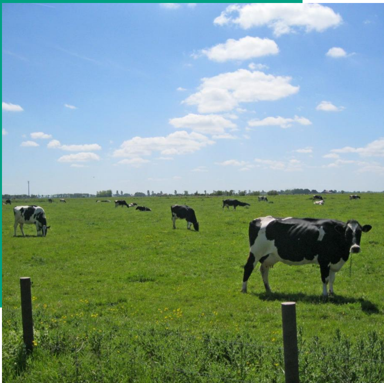
subsidieregeling fieldlab Groene Hart provincie Utrecht